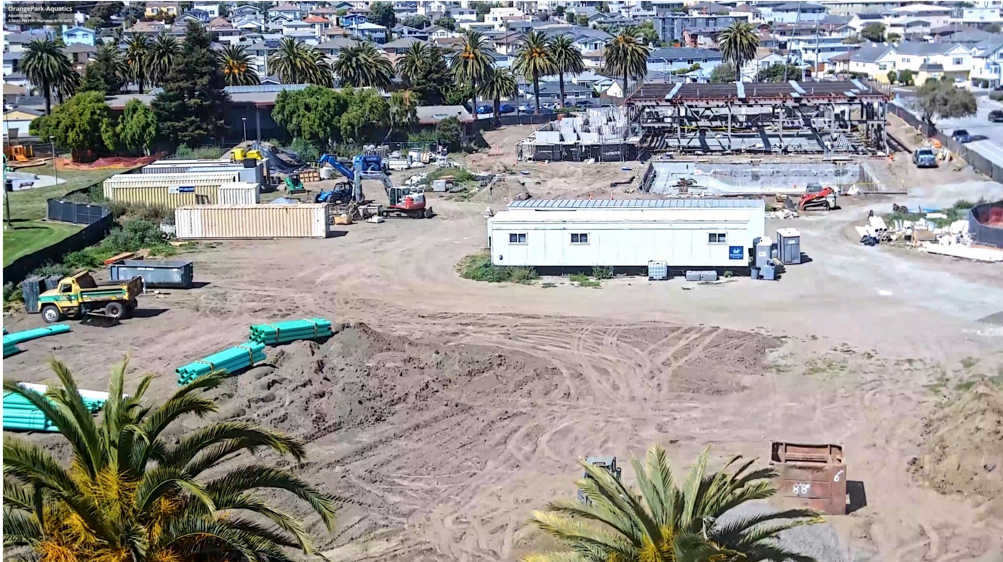
CONSTRUCTION LIVE CAM